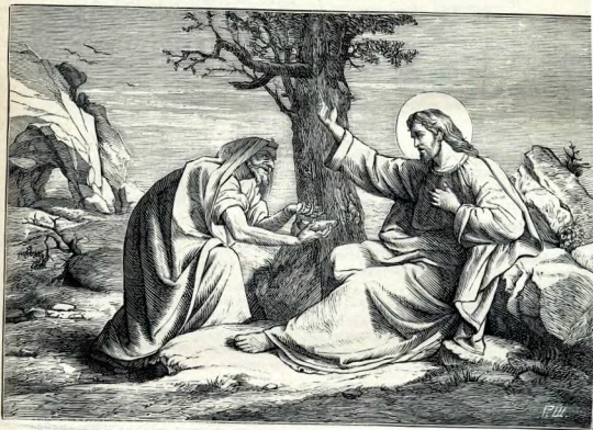
IX. Искушеніе въ пустынь.