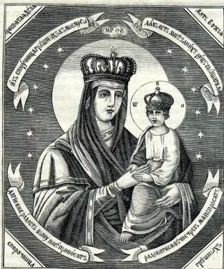
Икона Божіей Матери Споручницы грѣшныхъ.

Нѣкоторыя первоначальныя чудеса, происшедшія отъ той или другой иконы, придаютъ особый характеръ прославленію ея въ народѣ, и эта особенность передается изъ вѣка въ вѣкъ. Такъ, напримеръ, къ образу Пресвятыя Богородицы Неопалимой Купели прибѣгаютъ съ молитвой во время пожара и считаютъ его первой защитой отъ всепожирающей стихіи — пламени; Скорбящую Богородицу призываютъ при горѣ и несчастіи; Одигитрию